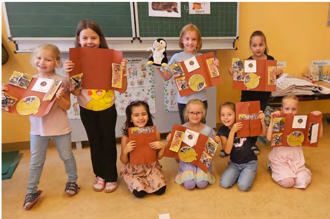
Die ersten Buchstaben werden beim Buchstabentag in der 1b Klasse gefestigt!

In den ersten Wochen haben die Schüler:innen bereits fleißig die Buchstaben „l,i“ „Ch,ch“ „B,b“ und „N,n“ erlernt. Am Buchstabentag festigten die Kids spielerisch ihr Wissen. In verschiedenen Spielen und Aktivitäten übten die Kinder mit Begeisterung die erlernten Schriftzeichen. Der Buchstabentag war ein toller Erfolg für die Schüler:innen der 1b. Sie freuen sich auf den nächsten Buchstabentag, an dem sie weitere Buchstaben erkunden und ihre Kompetenz weiterentwickeln können.