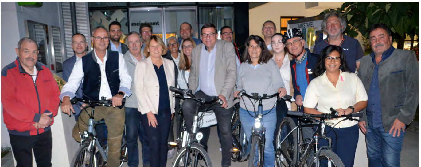
„Auf die Räder - fertig - los“ hieß es auch bei der Einladung zur Sitzung des Gemeinderats