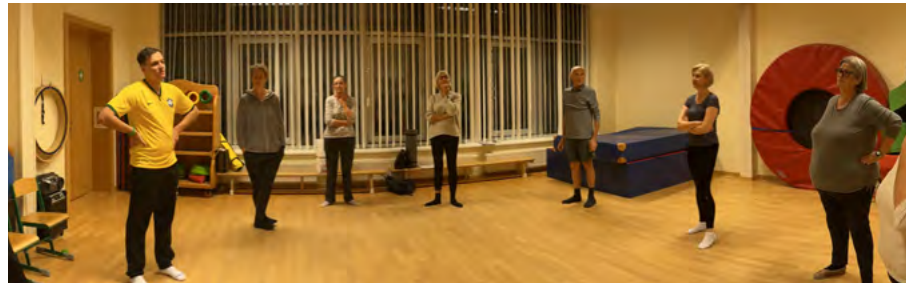
Bewegungseinheit mit den Teilnehmer:innen vom Programm „Vorsorge aktiv“ im Kindergarten Hagenbrunn

Mittlerweile haben sich die Teilnehmer:innen schon mehrmals mit den jeweiligen Betreuern und Trainern getroffen und sind somit bei Schritt 2 des Programms „Ich versuche es“ auf ihrem Weg zur persönlichen Lebensstiländerung.