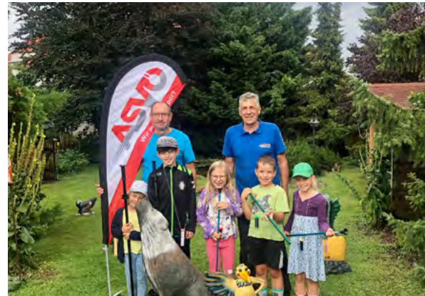
Ein aufregendes Abenteuer in der Natur erwartete die Kids beim Blasrohrschießen in den „Römergärten“!

gen Teilnehmer die verschiedenen Stationen und lernten spielerisch den Umgang mit dem Blasrohr. Es war ein aufregender Tag in der Natur, an dem die Kinder viel gelernt haben. Zum Abschluss gab es frisch geerntete Äpfel aus dem Garten. Der Ferienspieltag war ein voller Erfolg und wird den Kindern noch lange in Erinnerung bleiben!